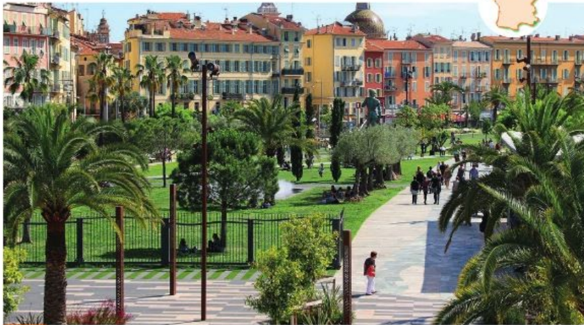
Doc. 2 La « coulée verte » ou « Promenade du Paillon » à Nice dans les Alpes-Maritimes (Provence-Alpes-Côte d'Azur)

Cette promenade doit son nom au fait qu'elle a été aménagée sur le fleuve Paillon. Ce fleuve côtier a été progressivement enterré depuis le milieu du XIX e siècle. La réalisation du projet a pris plus d'un siècle : en effet, les crues du fleuve ont interrompu à plusieurs reprises les travaux. Le projet avait pour but de restructurer le centre-ville en facilitant la circulation entre la vieille ville et les nouveaux quartiers qui se développaient alors sur la rive droite du fleuve et d'offrir aux habitants un espace public avec jardins.