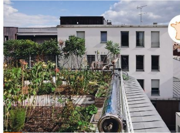
Doc. 4 Un jardin potager sur le toit d'un immeuble à Paris (Île-de France)

J'étudie une photographie. Je fais des hypothèses.